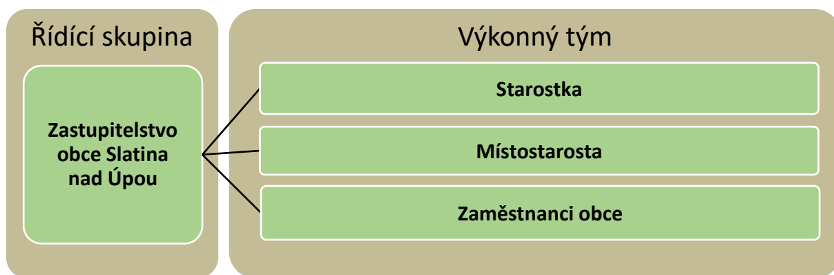
Schéma 3: Znázornění systému řízení a organizačního zajištění naplňování PRO Slatina nad Úpou na období let 2019-2028

Efektivní naplňování strategického plánu může být obecně zajištěno jedině díky jednoznačnému systému řízení. Platí to i pro tento rozvojový plánovací dokument. Jedná se tedy o zajištění postupného naplňování stanovené vize, strategických cílů, opatření a aktivit. Pro tyto účely byly stanoveny následující dvě hierarchické úrovně systému řízení a organizačního zajištění naplňování PRO (viz schéma 3).